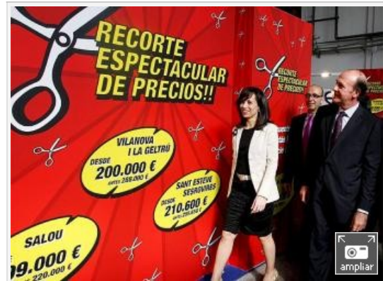
La ministra de Vivienda, Beatriz Corredor, hoy en la feria de la vivienda low cost .