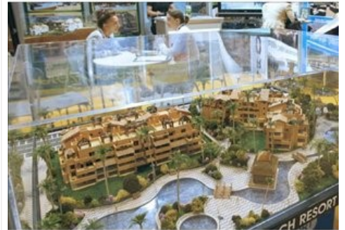
Novedades en el sector inmobiliario